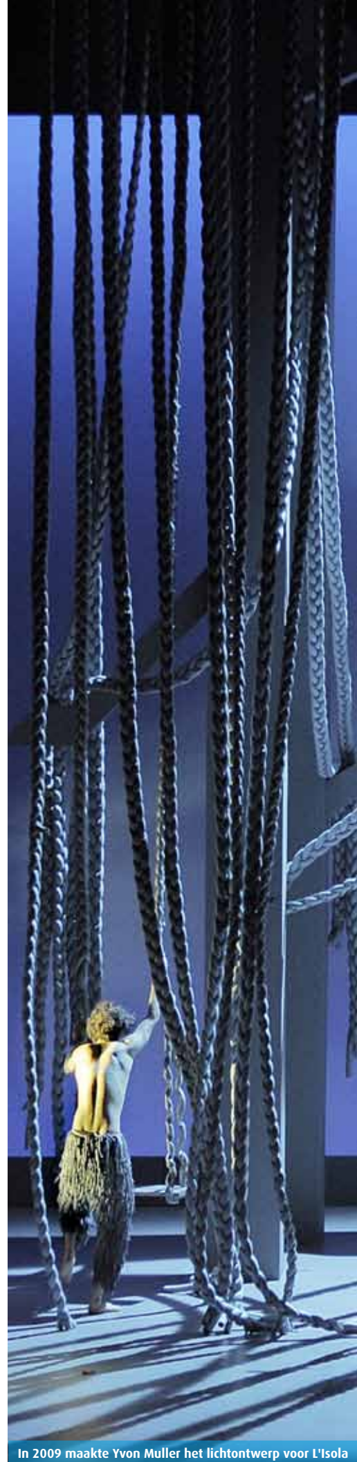
In 2009 maakte Yvon Muller het lichtontwerp voor L'Isola

voor een wisselwerking creëer. Ontwerpen voor het theater trekt mij omdat je in deze discipline altijd te maken hebt met de begrippen 'tijd' en 'dynamiek'. Daarin vind ik transformatie een belangrijk element. Ik wil niet louter statische beelden in de tijd plaatsen, maar het gaat me om het regisseren van visuele indrukken, en het verschijnen en verdwijnen ervan, om daarmee karakter te geven aan de beleving. En licht is volgens mij de belangrijkste manipulator als het gaat om dat 'karakter van de beleving'. Daarnaast kan ik met licht mensen ook bewust maken van hun eigen kijken en ervaren. Licht is waarneming, stuurt het aan. Al met al