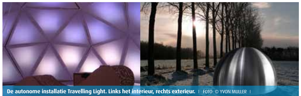
De autonome installatie Travelling Light . Links het interieur, rechts exterieur.

Het meest recente werk op het gebied van pixelmapping is mijn eigen autonome lichtinstallatie Travelling Light (2009). Een lichtervaring voor één persoon waarbij een koepelvormig lichtplafond van leds wordt aangestuurd door een camera op het dak. Daarmee scan je als toeschouwer zelf de omgeving af. Travelling Light is een pure ervaring van licht. Dagelijkse indrukken van de wereld om