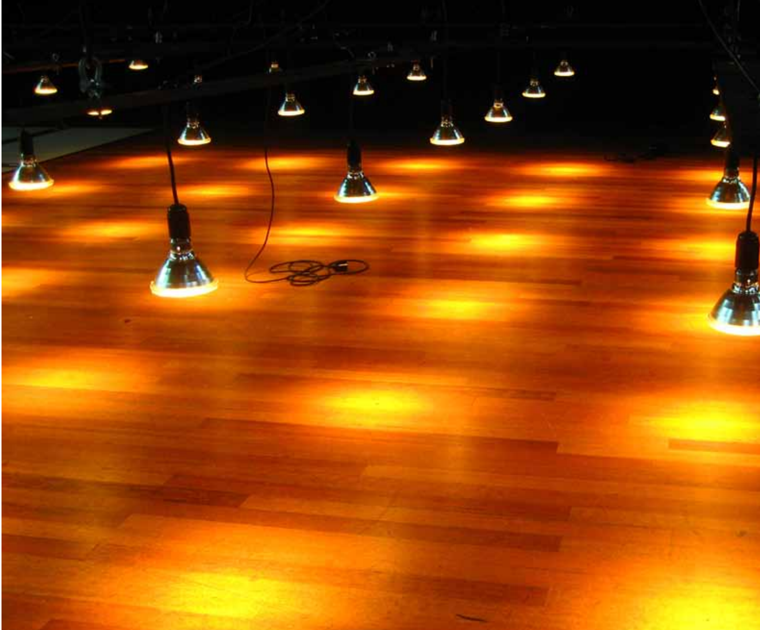
'Een heel andere manier van denken' bij Memento (2009) van Stichting RoodPaleis, met toepassing van pixelmapping.

werd ik uitgedaagd om verder te duiken in de inhoudelijke en artistieke kanten van het vak lichtontwerpen. Ik vond het fascinerend om te merken, tijdens de vele gesprekken gedurende de workshop, hoe universeel en rijk de taal van het licht is.