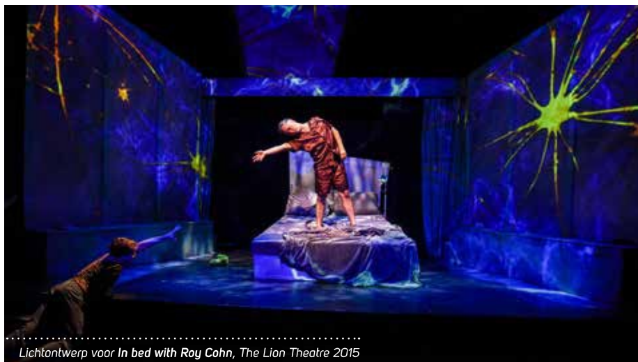
Lichtontwerp voor In bed with Roy Cohn , The Lion Theatre 2015

“De ene maand kom ik om in het werk, maar in een andere maand tref ik mezelf in een kelder aan met zes lampen en vraag ik me af wat ik in hemelsnaam aan het doen ben. In Amerika zijn er niet zo veel gezelschappen of groepen waarbij je je kunt aansluiten. Je moet continu netwerken en mensen ontmoeten. NYU was een goede opstap. Daar doe je veel contacten op. Soms leidt een kleine opdracht onverwacht tot een nieuwe, veel grotere opdracht en aan de andere kant hoor je na het doen van een grote productie soms ook niks meer van de mensen waarmee je zo intensief hebt samengewerkt.” Enkele opdrachten als associate lighting designer verhoogden Houbens aanzien op Broadway. Als associate